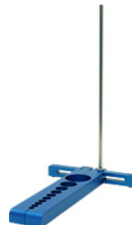
KPT-MS-mini Turn stand-mini, 450mm