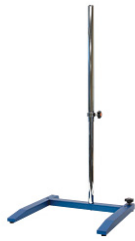
KPT-1000H Plate stand-T, 1,000mm