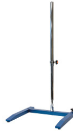
KPT-1000U U-stand, 500~1,000mm