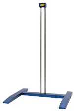
KPT-800H H-stand, 800mm