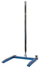
KPT-1000H H-stand, 1,000mm