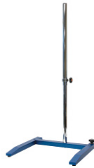
KPT-1000TH Telescopic H-stand, 500~10,000mm